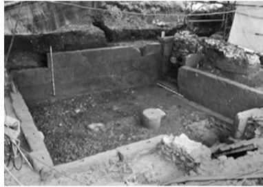
Archéologie romaine / C. Mary-Camella

À l'époque gallo-romaine, Crissier se trouvait au carrefour des routes de Genève à Yverdon et du Grand-St-Bernard au Col de Jougne. À environ 100 m. au nord-est de l'église, on a découvert au 19 e s. les vestiges d'une villa romaine, au lieu-dit Montassé. S'ensuivirent des fouilles sauvages dans les années 1960, puis des investigations scientifiques au cours des années 1970. Elles révélèrent un portique de façade long de 70 m. ainsi qu'une cave, élément rare en dehors des villes et qui a peut-être aussi servi de lieu de culte.