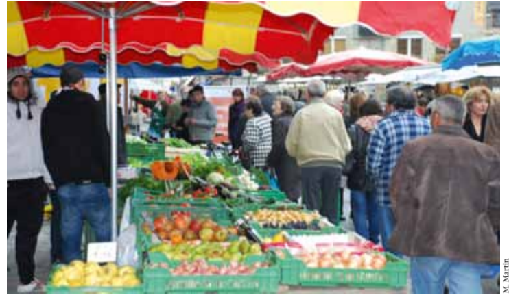
... en passant par la Place du Marché de Renens.