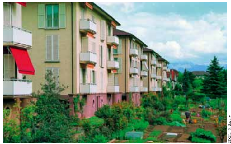
À la découverte des nombreux potagers et des zones maraîchères méconnus de l'Ouest lausannois...