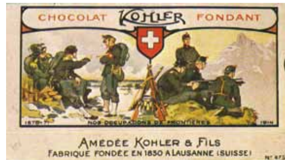
Marcel Imasud in: Encyclopédie illustrée du Pays de Vaud, 1972