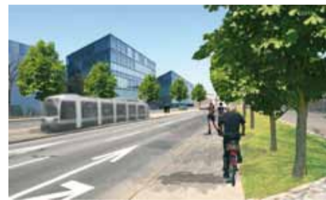
SDOJ / CCHE

Le réseau de transports publics en site propre (axes forts) à créer dans l'agglomération a été validé par le Conseil d'Etat vaudois en mai 2008. Il comprend entre autre un tramway reliant le Nord lausannois à Bussigny et desservant, dans l'Ouest lausannois, les secteurs de Malley, de la gare de Renens, de l'Arc-En-Ciel et de Cocagne-Buyère. Cette ligne, cofinancée par la Confédération, sera réalisée en plusieurs étapes. Les travaux du premier tronçon, entre les gares de Renens et du Flon, débuteront durant la période 2011 à 2014. Des lignes de trolleybus à aménager en site propre compléteront ce réseau, notamment entre Lausanne et Bussigny via Prilly et Crissier. Ces travaux offrent l'occasion de réorganiser les rues traversées, dans le but d'améliorer leur convivialité (arbres, trottoirs, places publiques, etc.) et de laisser plus d'espace aux piétons et aux cyclistes.