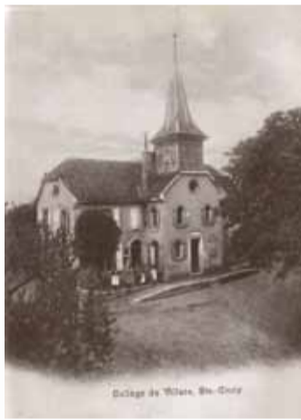
A. Bonzon, J.-C. Marenzeller, Ch. Palud, 1983

Pour freiner l'étalement urbain, économiser le sol et améliorer l'attractivité des transports publics, de la marche et du vélo, le Projet d'agglomération Lausanne-Morges (PALM) concentre le développement urbain à l'intérieur de l'agglomération dite « compacte », délimitée en continuité avec les secteurs bâtis existants et de façon à préserver les paysages, les surfaces agricoles et les milieux naturels. L'agglomération compacte doit accueillir près de 40'000 habitants et 35'000 emplois nouveaux à l'horizon 2020 par la densification du bâti existant et par le développement de sites stratégiques, dont plusieurs se situent dans l'Ouest lausannois.