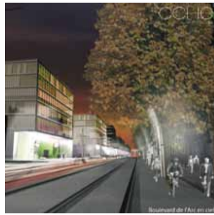
SDOJ / CCHE

Cet axe rectiligne de plus d'un kilomètre de long mène de Renens à Bussigny. Une fois réaménagé en un boulevard bordé d'arbres et de commerces accessibles grâce à une nouvelle ligne de tram, il va devenir le moteur de la reconversion de cette zone industrielle en un quartier urbain diversifié. Il sera ponctué de places et mis en valeur par des bâtiments emblématiques.