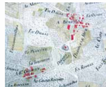
Archives cantonales vaudoises