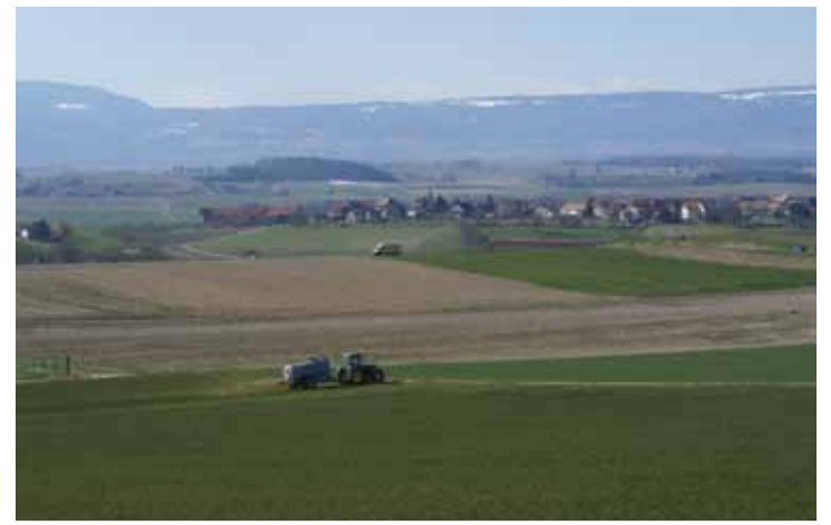
Promenade dans l'Ouest agricole au milieu des champs...