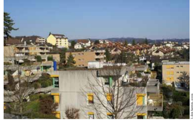
... et vue plongeante sur l'Ouest urbain en plein développement.